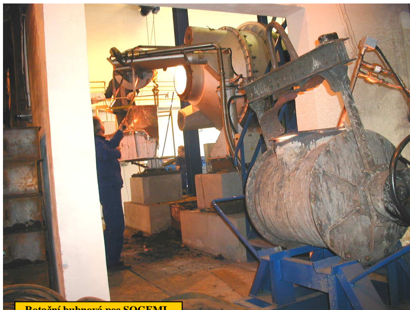
Rotační bubnová pec SOGEMI