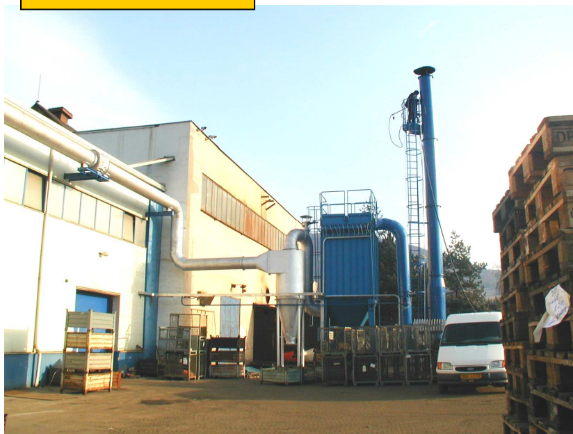
Odprašování rotační pece