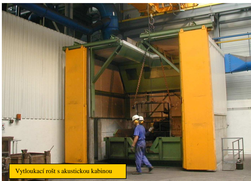
Vytloukáč rošt s akustickou kabinou