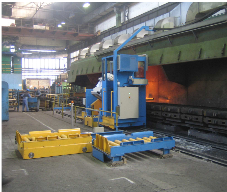
Celkový pohled na lící zařízení