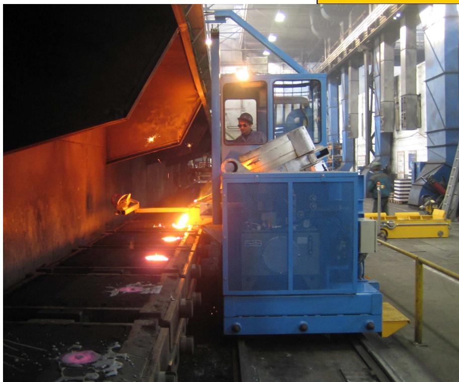
Odlévání s kontrolou teploty