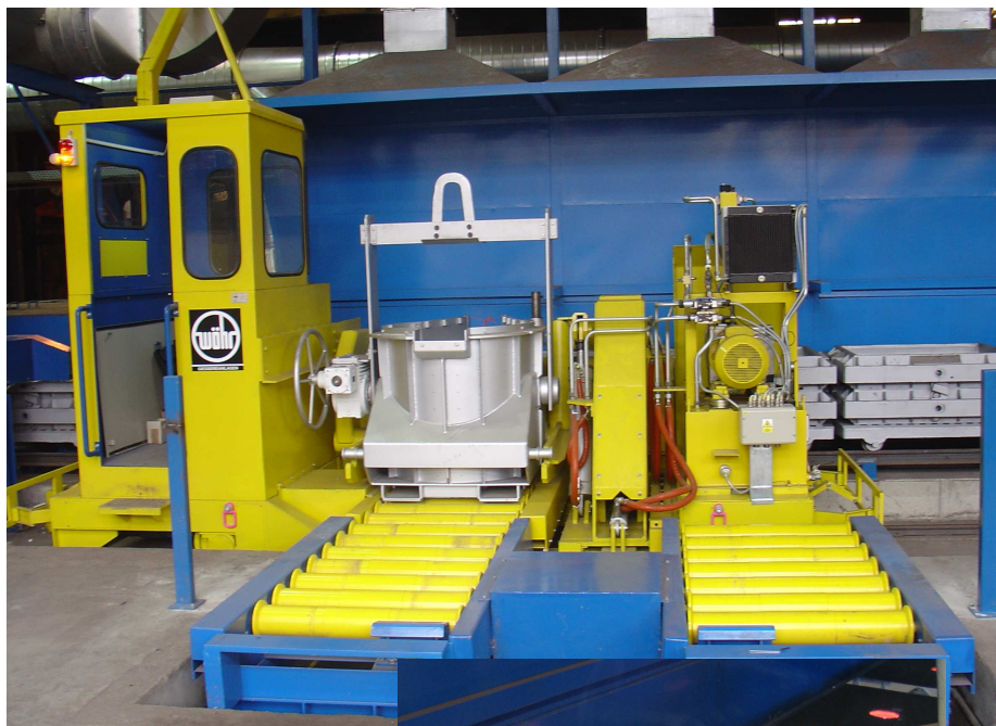
Celkový pohled na lící zařízení