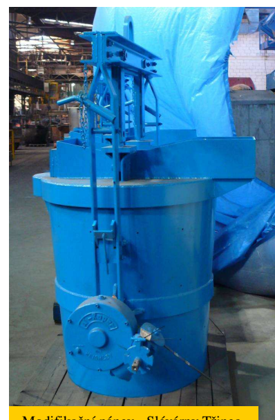
Modifikační pánve - Slévárny Třinec