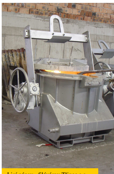
Licí pánve - Slévárny Třinec a.s.