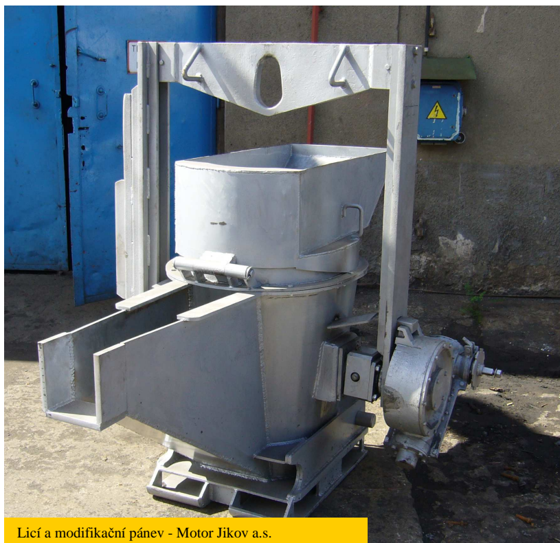
Licí a modifikační pánve - Motor Jikov a.s.