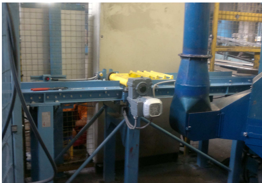
Celkový pohled na pracoviště