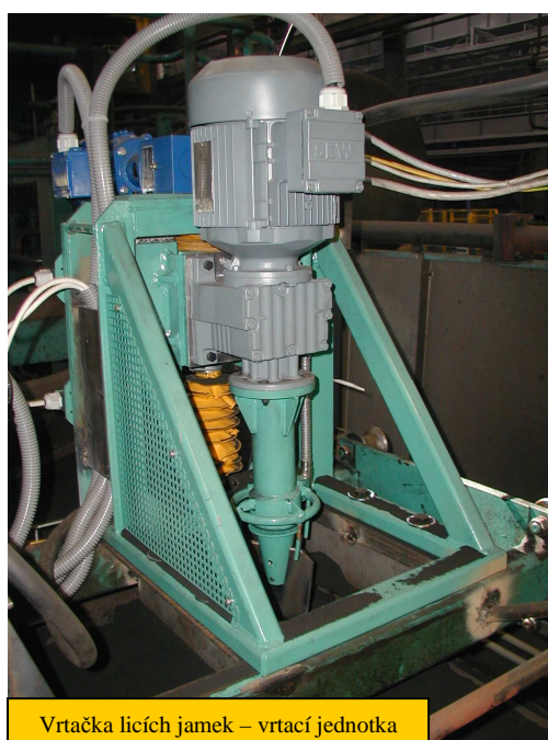
Vrtačka licích jamek – vrtací jednotka