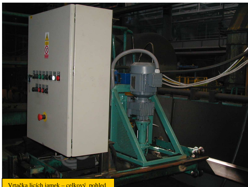
Vrtačka licích jamek – celkový pohled